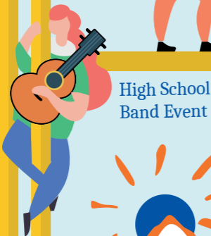
High School Band Event