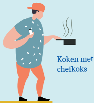
Koken met chefkoks