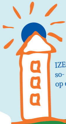
IZEO Koraal Urmond: so- en vso-leerlingen op één locatie